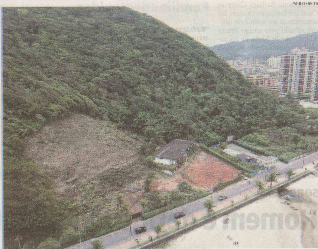
Em três dias, empresa do Grupo Camargo Corrêa desmatou o equivalente a 4 campos de futebol de salão